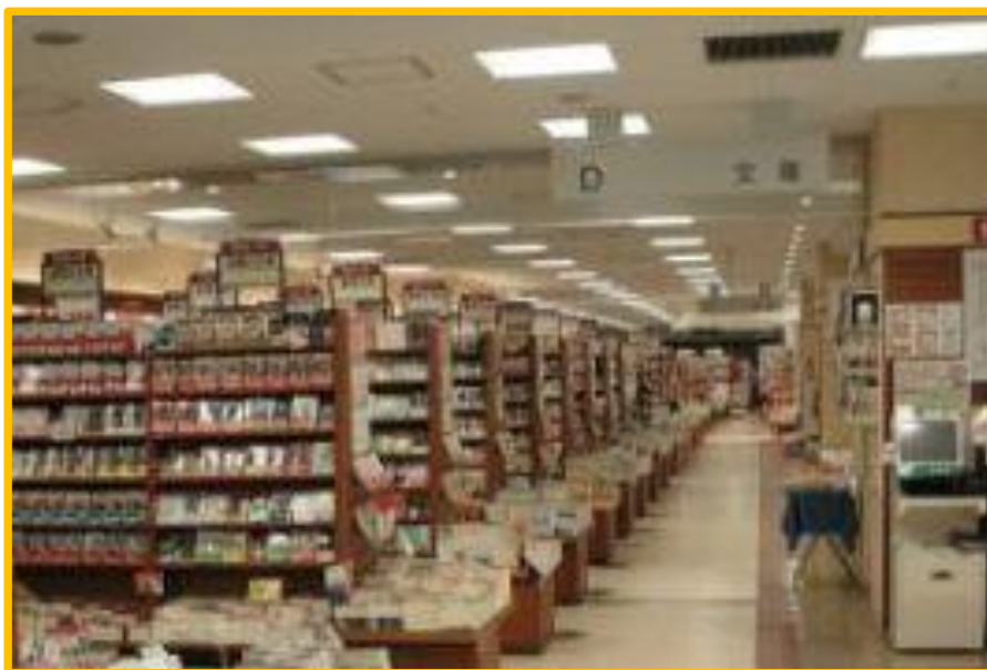
【 S書店 様 】