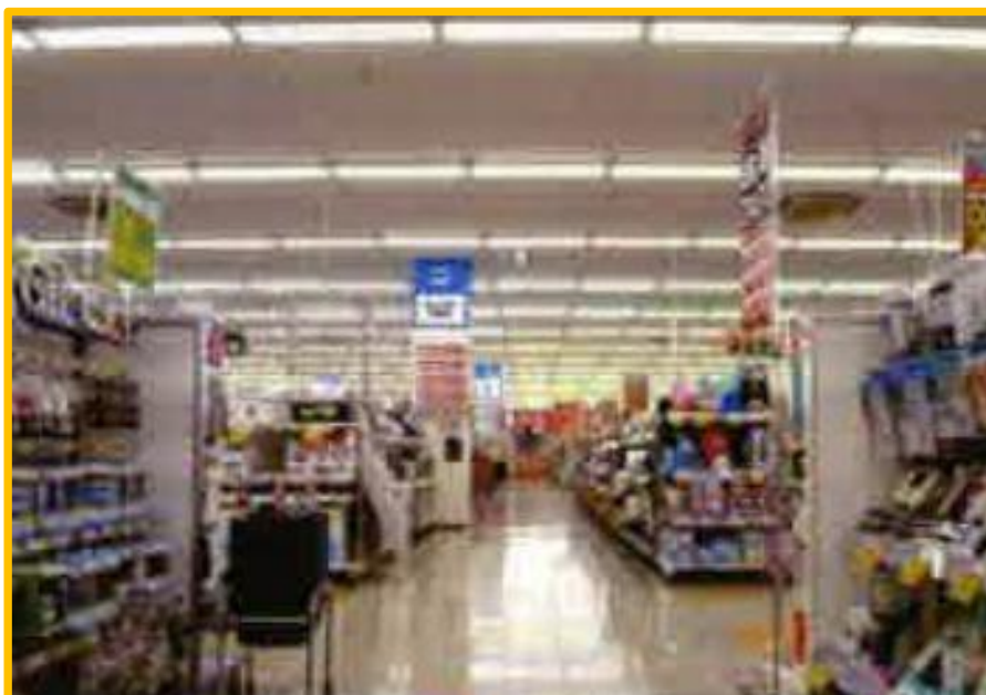
【 B電器 様 】